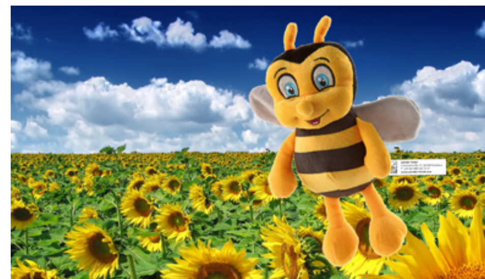
Wie soll unser Honig Maskottchen heißen? Gebt Eure Vorschläge an der Rezeption ab und gewinnt einen tollen Preis!

Wir würden unserem Maskottchen gerne einen Namen geben. Bitte überlegt Euch was Schönes und gebt Eure Idee mit Namen und Anschrift an der Rezeption ab. Für den Gewinnernamen gibt es einen attraktiven Preis. Vielen Dank!