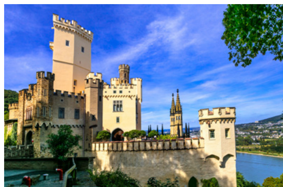
Das Schloss Stolzenfels liegt hoch über dem Rhein

Schräg gegenüber von Schloss Stolzenfels in Braubach liegt die Marksburg. Ihr Wert liegt vor allem in ihrer vollständigen Erhaltung. Die Marksburg wurde trotz vieler Versuche nie zerstört und präsentiert sich deshalb heute als komplett erhaltene mittelalterliche Wehranlage. Es ist alles da, was zu einer richtigen Burg gehört. Burgküche, Rittersaal, Kemenaten, Kapelle, Rüstkammer und der Weinkeller. Wir wünschen viel Spaß bei einer Reise ins Mittelalter.