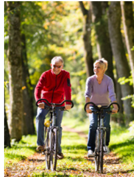
Auch wenn es einige wenige Steigungen gibt, der Weg selbst ist auch für ungeübte Fahrer geeignet

viele Weinberge, malerische Ortschaften wie Winningen, Koblenz-Gondorf und Brodenbach erleben. Die Landschaft ist so abwechslungsreich, dass für jeden Geschmack etwas dabei ist. Dazu kommt, dass das Profil der Strecke relativ flach für diese Landschaft ist, so dass auch weniger ambitionierte Radfahrer eine längere Tour fahren können.