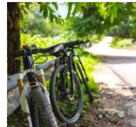
Viele Stellen an der Mosel laden ein, die Gegend zu genießen

Mit der App "Lauschpunkte am Mosel-Radweg" wird die Radtour zu akustischen Entdeckungsreise. Sie ist sowohl für Android als auch iOS verfügbar und bietet entlang des Radwegs 40 Hörstationen, die Dir mehr über die entsprechende Gegend erzählen. Sei es zur historischen Bedeutung, zur Kultur