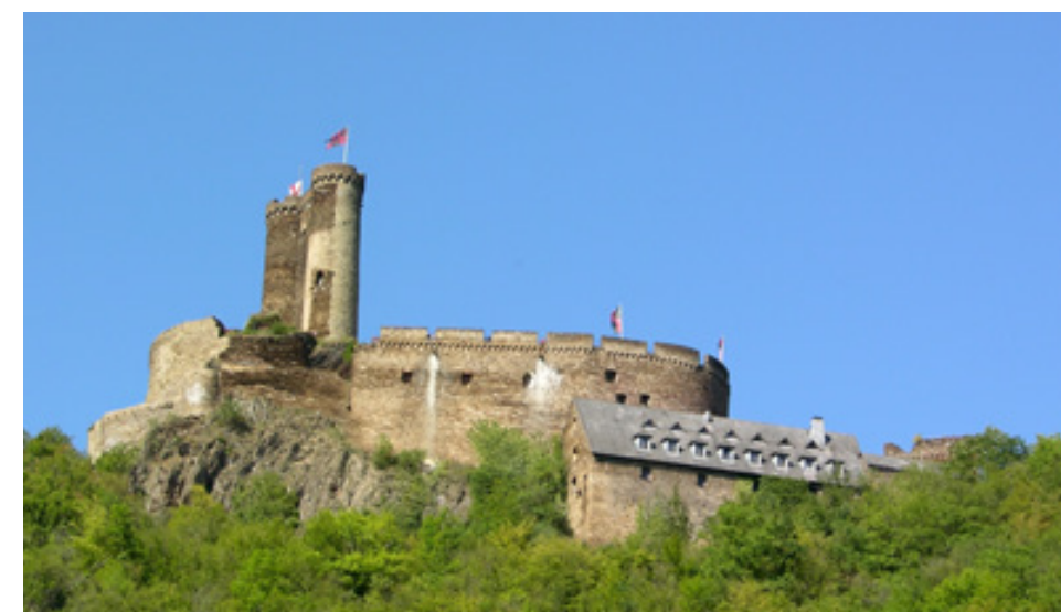
Das Highlight des Jahrsberg-Rundweg ist die Ehrenburg

Öffnungszeiten Di - Do 10.30 bis 15.45 Uhr Sa + So 10.00 bis 17.15 Uhr