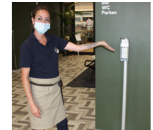
In der Lobby kannst Du einen Handdesinfektspender finden

Wenn Ihr ins Hotel kommt, werdet Ihr von unseren Rezeptionisten begrüßt - 1,5 Meter Abstand zur Theke sind auch hier PFLICHT. Dort gibt es auch Schutzmasken und wichtige Tipps für