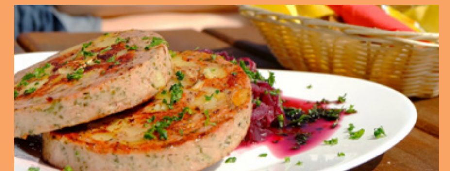
Eine der bekanntesten lokalen Delikatessen ist der gefüllte Schweinemagen

Natürlich bietet die Koblenzer Gastronomie eine breite Auswahl an internationaler Küche. Ganz sicher ist für jeden Geschmack etwas zu finden.