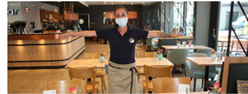
Willkommen zurück! Wir tun alles dafür, dass Du sicher bei uns Deinen Aufenthalt genießen kannst

Seit der Wiedereröffnung des sander Hotels am 18. Mai für alle Gäste haben wir mit vielen wichtigen Maßnahmen die offiziellen Vorgaben der Behörden und des Robert-Koch-Instituts umgesetzt. „Abstand halten und Mund-Nasenschutz tragen“ ist dabei der wohl wichtigste Aspekt.