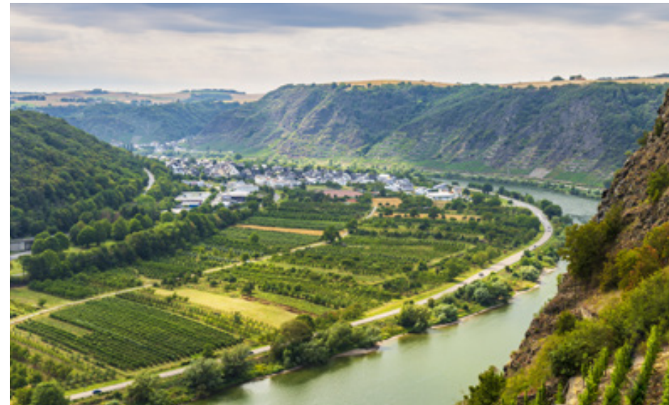
Radfahren entspannt an der Mosel entlang - Der Mosel-Radweg

Die Moselregion eignet sich besonders für Radfahrer, denn der Mosel-Radweg ist vollständig an das Radverkehrsnetz angeschlossen. Mit dem Mosel-Radweg lassen sich so bequem alle Schleifen, Kurven und Aussichtspunkte besonders gut erfahren.