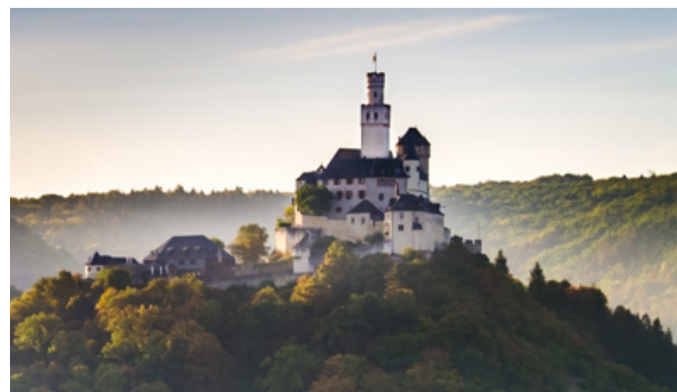
Eine der schönsten Burgen im Mittelheintal ist die Marksburg

Wie auch in unserer Tiefgarage können Reservierungen nicht vorgenommen werden. Es gilt das Prinzip „Wer zuerst kommt, mahlt zuerst“.